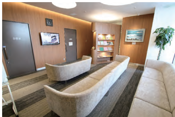
ふかふか絨毯と、座り心地の良いソファー (明石駅前クリニック待合室)

このように、明石駅前クリニックと本院の情報システムは全て共有化されているため、場所は離れていますがクリニックは7番目の診察室(※)とってご利用ください。今後とも明石駅前クリニック、本院、それぞれ通院しやすい方をご利用いただき、わずかでも通院のご負担軽減になればと思います。