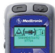
※2: 脊髄刺激装置 コントローラー (メドトロニック社製) MRI-CS モード