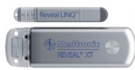
※1 植込み型心電計 (メドトロニック社製)