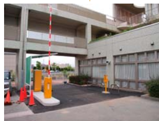
駐車場出口（ここで料金をお支払いください）