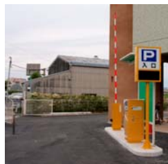
駐車場入口（駐車券をお取り下さい。）