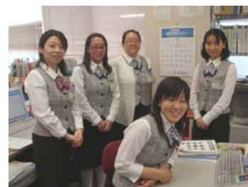
診療情報管理士と医事課の担当者

「オースニュース」の内容に関するお問い合わせは地域医療連携室（078-938-0399）まで