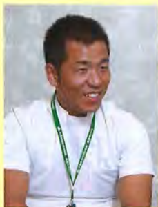
脳神経外科部長 手術部長 救急部長