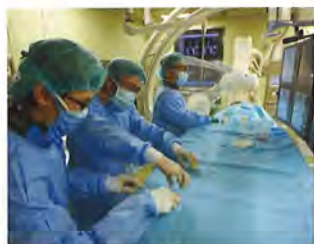
ハイブリッド手術で行われる脳血管内治療。手術室は同様力を入れる脳外科手術でも活用される