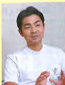
脳神経外科部長 脳血管内治療科主任部長 脳卒中センター長