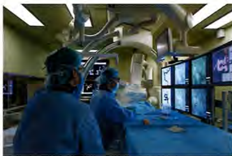
ハイブリッド手術室で行われる脳血管内治療

変を処置する脳血管内治療が注目されている。日本脳神経血管内治療学会認定脳血管内治療専門医が3名在籍する体制を敷き、同治療に注力してきたのが、兵庫県明石市の大西脳神経外科病院だ。同院での脳血管内治療はさまざまな症例で用いられているが、中でも脳動脈瘤においては年々患者数が増え続けているという。「脳動脈瘤への脳血