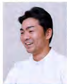
脳神経外科部長 脳血管内治療科 主任部長