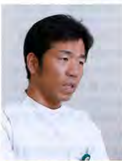
脳神経外科部長 手術部長 救急部長

収療法を中心とした救急医療だ。同院では細い末梢血管まで届く最新機器も取り入れ、より多くの症例への対応を可能にしている。加えて、脳血管内治療を24時間365日提供できる診療体制のもと、迅速な治療の実現にも力を入れてきた。「特に脳梗塞では、病院への到着から治療までの時間が成績