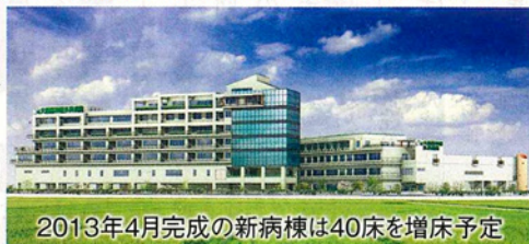
2013年4月完成の新病棟は40床を増床予定