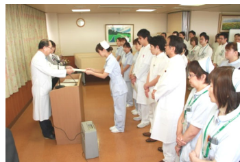
（辞令を受け取る新入職員）

続いて新入職員オリエンテーションが2日間に渡って行われ、各部門からの講義に熱心に耳を傾けていました。